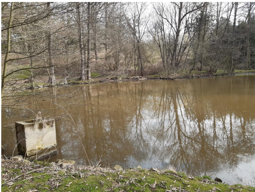
VN Frýdek - požerák