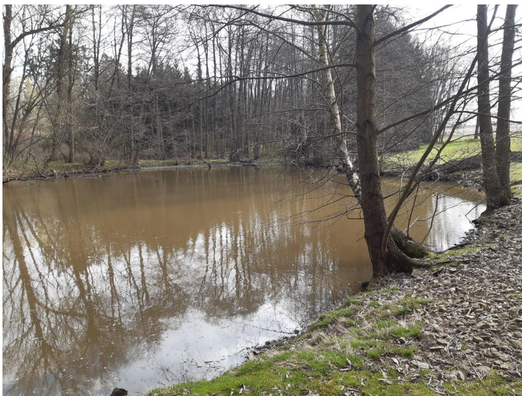
VN Frýdek - zátoka 2