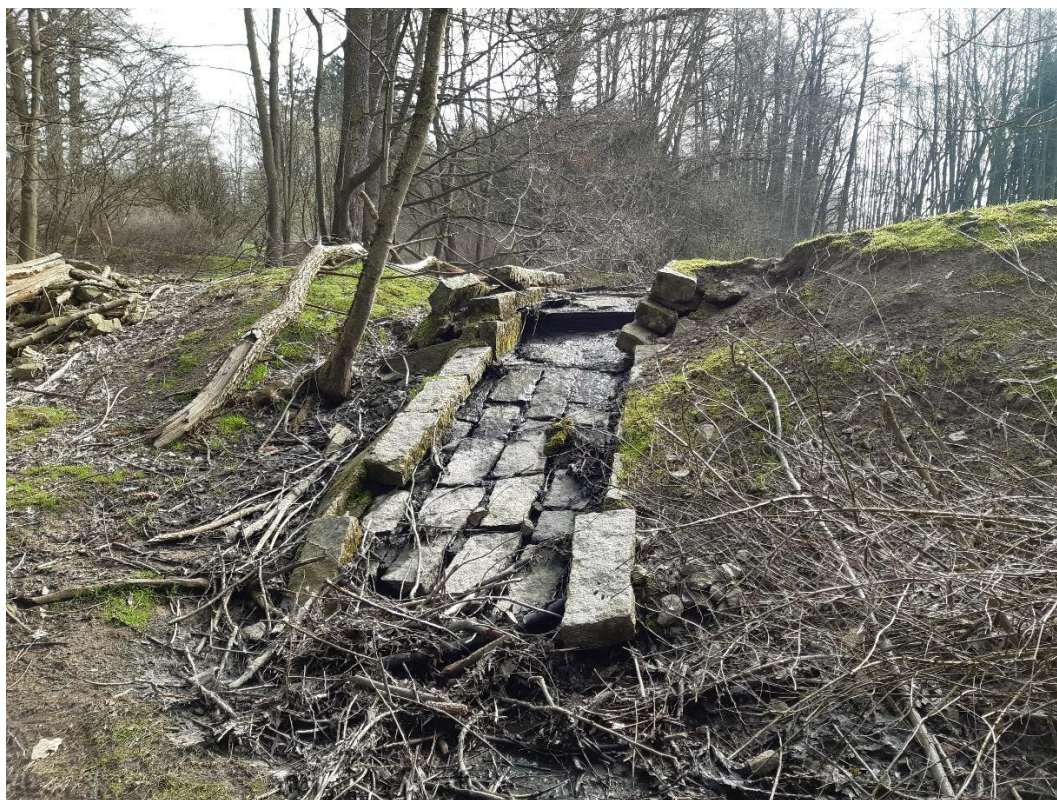
VN Frýdek - bezpečnostní přeliv 2