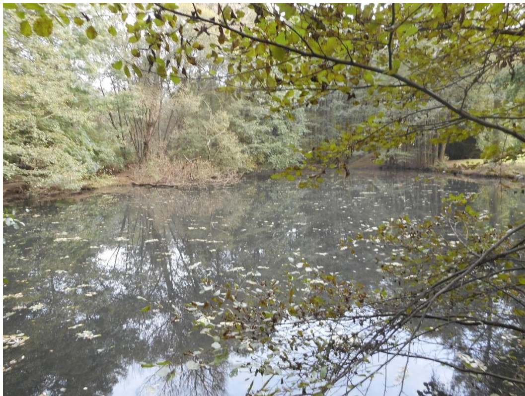
VN Frýdek – zátoka 1