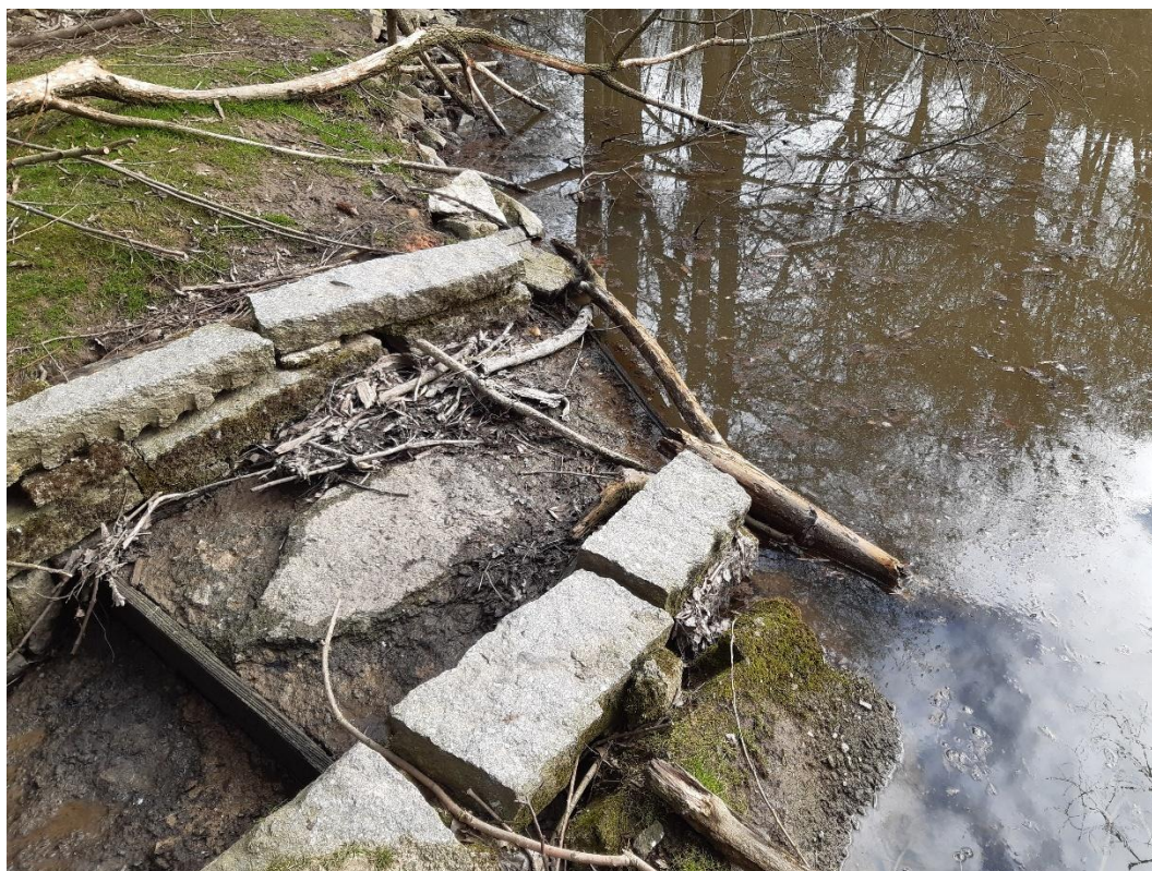
VN Frýdek - bezpečnostní přeliv 1