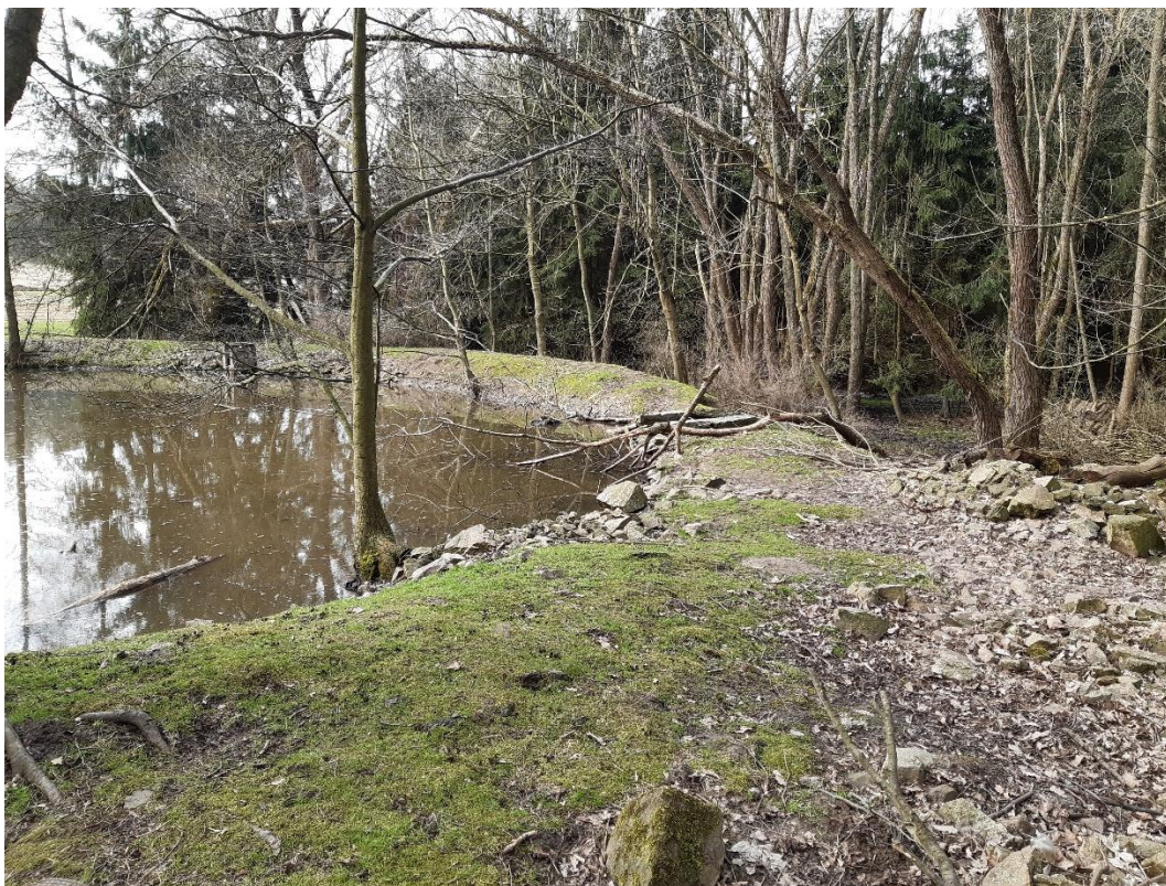
VN Frýdek - hráz