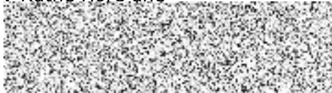
Město Kutná Hora pronajímatel