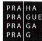
Příloha č. 1 Položkový rozpočet

EVROPSKÁ UNIE Evropské strukturální a investiční fondy Operační program Praha – pól růstu ČR