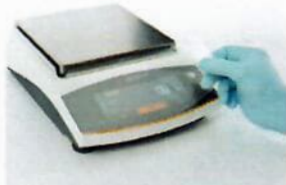
YDC10, Display protection film (Set of 5 pieces)

a mnoho dalších příslušenství obrázkem níže, ceny na dotaz.