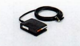
YFS03, Foot switch