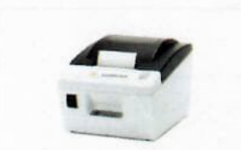
YDP40, Thermal printer (USB-B)