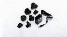
YEPS01-15V0W, Power supply