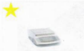
YDC30, Dust cover for balances with rectangular weighing pan