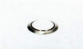
YSP02, Shield disk for analytical balances