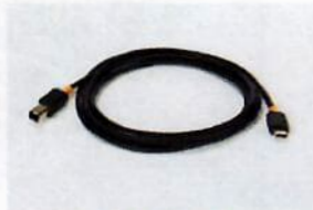
YCC-USB-C-B, Data cable