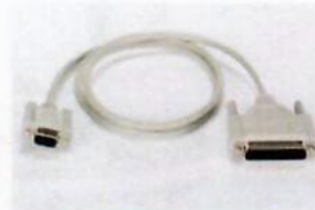
69Y03130, Data cable