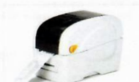
YDP30, Thermal transfer printer (USB-B, RS232)