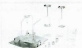
YDK03, Density determination set