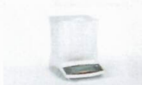
6960BC01, Dust cover for balances with analytical draft shield