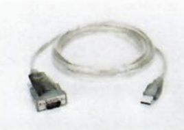
YCC-D09M-USB-A, Data cable