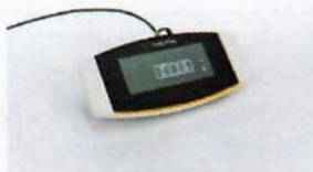
YSD01, Second display