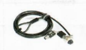
YKL01, Kensington-lock cable