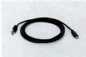
YCC-USB-C-A, Data cable