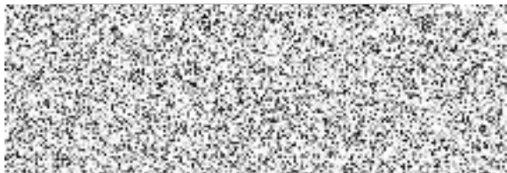
Zástupce poskytovatele Vladimír Mauer