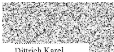
Dittrich Karel kupující

pořadové číslo nabízené nemovitosti dle evidence PF ČR: 3121235, 3121335, 3205635, 3207835, 3208535, 2366235, 2366335, 2366535, 2366735