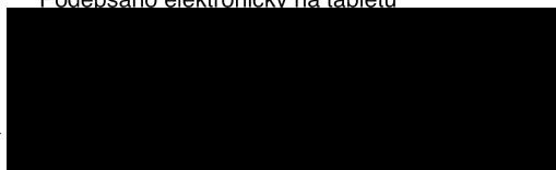
Bankéř pro zivnostníky a malé firmy MONETA Money Bank, a.s.

PRAHA 5-ZBRASLAV dne 07.04.2026 14:31 Podepsáno elektronicky na tabletu