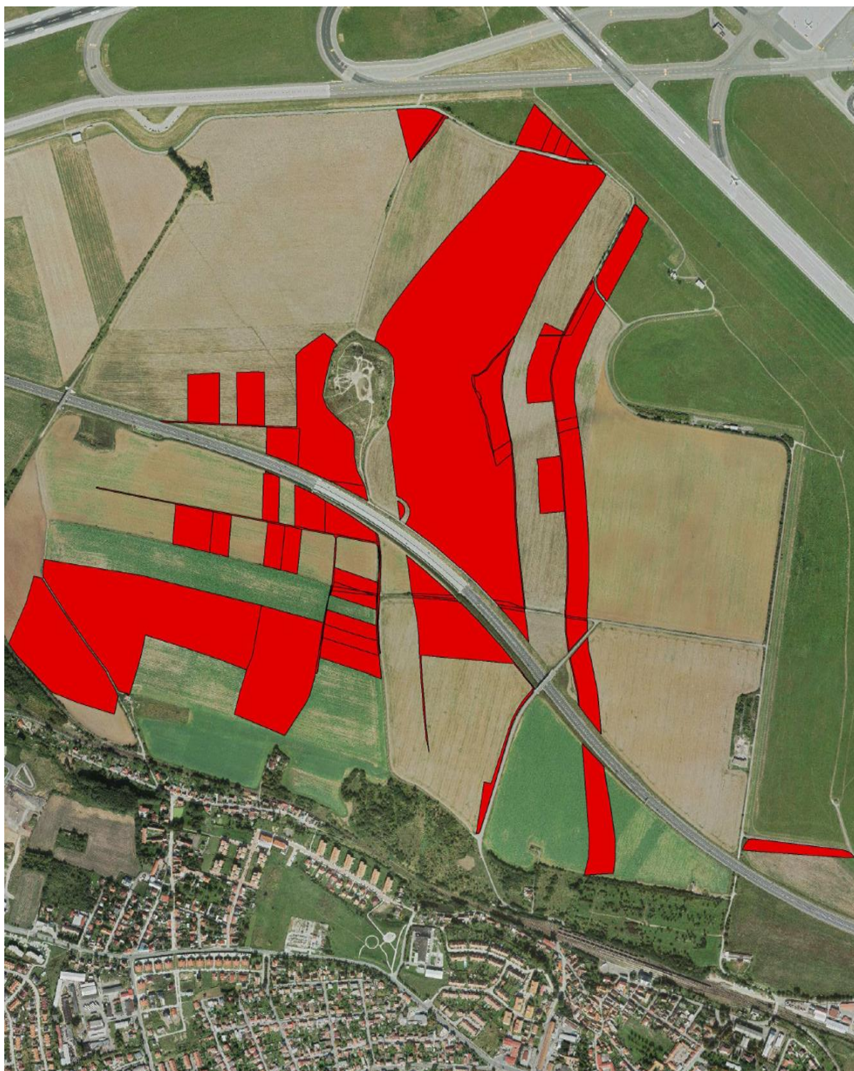
Příloha č. 2 Smlouvy ev.č. 0111002758 – Ortofotografická mapa s Předmětem pachtu