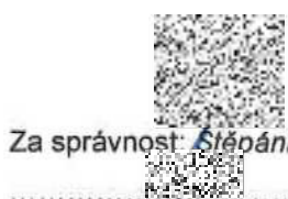
Za správnost Štěpánka Ráczová