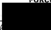
_____ jednatelka společnosti

FORCORP GROUP s.r.o. 32 Olomouc-Hodolany 779 00 1031 DIČ CZ27841031 forcorp@forcorp.cz www.forcorp.cz