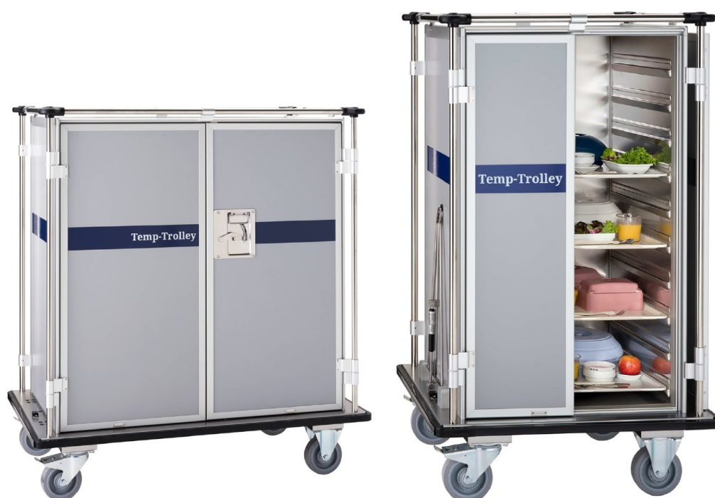
Obr. Přepravní vozík