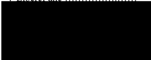
Mgr. Jiří Ulvr náměstek hejtmana Libereckého kraje na základě plné moci