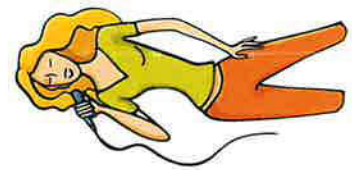
SOLO Voc. 1 x wireless