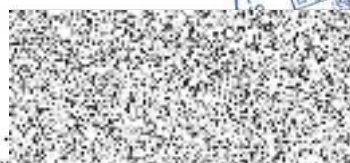
Oprávněný zastupce Středočeského kraje