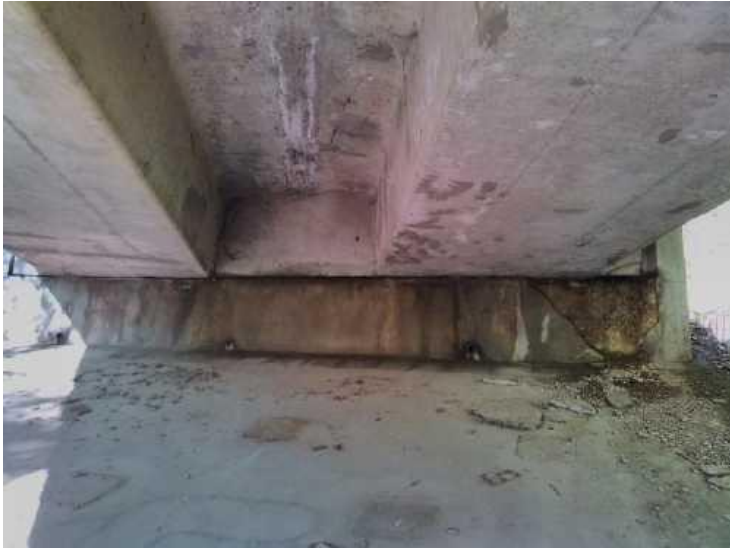
Pohled na O4 - hloubková degradace betonu v místě intenzivních průsaků dilatační sparou.