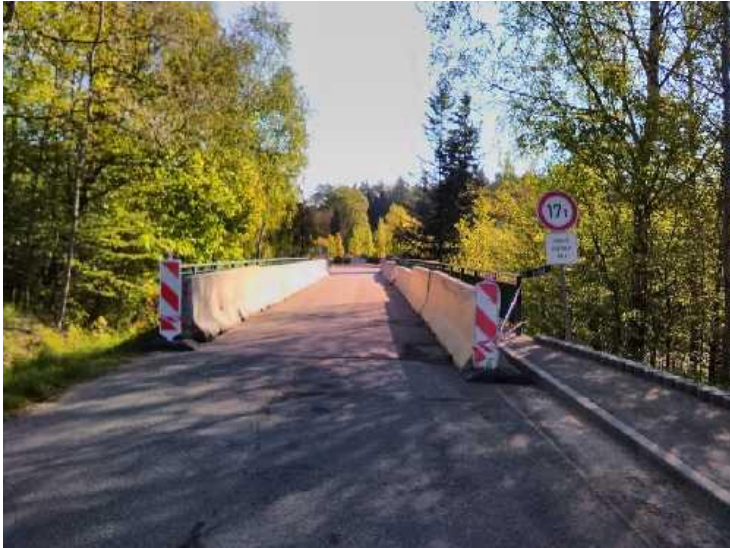
Příčné uspořádání na mostě.