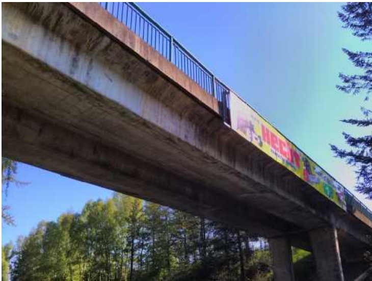
Pohled na most. Nepravidelné trhliny na levém boku levého nosníku v 2. Poli.