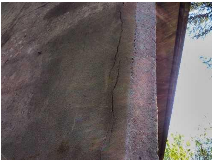
Trhlina charakteristická pro separaci krycí vrstvy nad korodující výztuží u levé stojky P2.