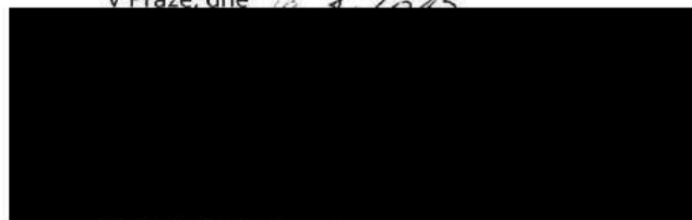
Ředitel, Veřejná správa Na základě pověření

O2 Czech Republic a.s. Za Brumlovkou 265/2 140 22 Praha 4 DIČ: CZ60193336