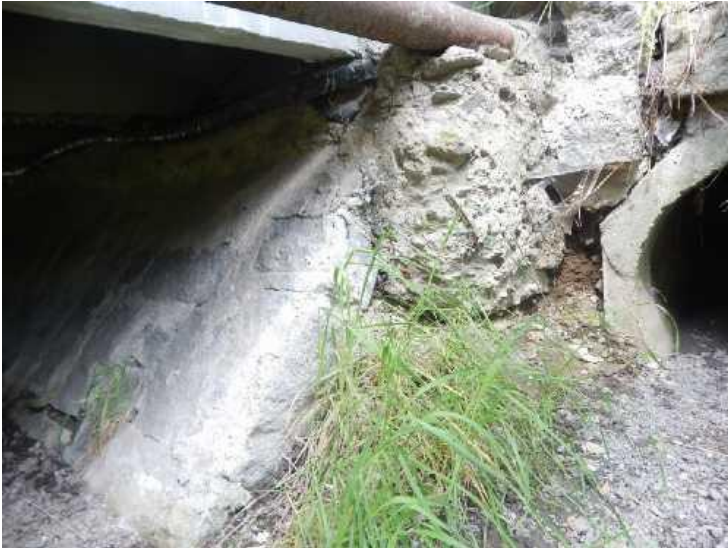
Nedostatečné podepření chráničky inženýrských sítí na levé straně opěry OP1.