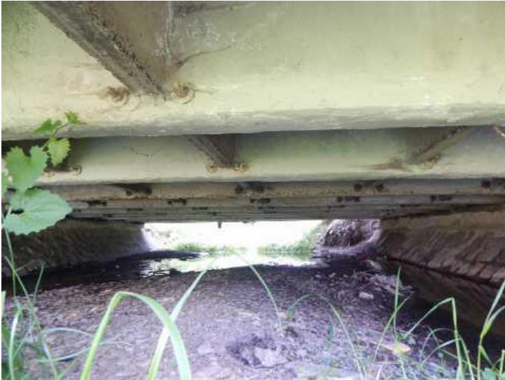
Spodní líc nosné konstrukce.