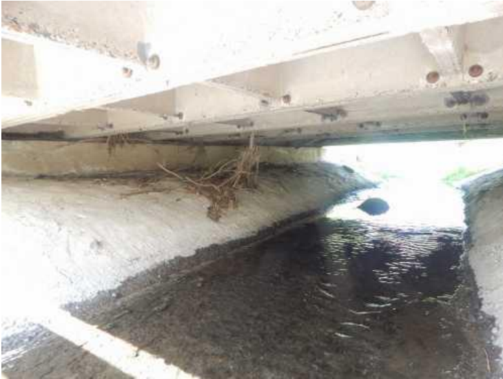
Spodní líc nosné konstrukce.