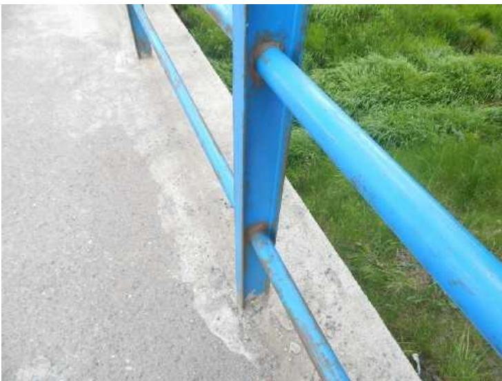
Detail koroze ocelového zábradlí v místě napojení madla na sloupek.