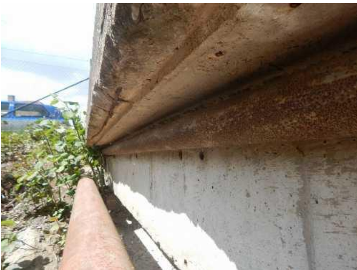
Povrchová koroze ocelových chrániček.