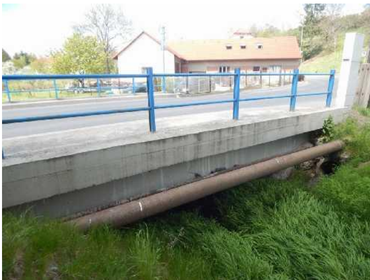
Pohled na levý bok mostu s dvojití ocelových chrániček.