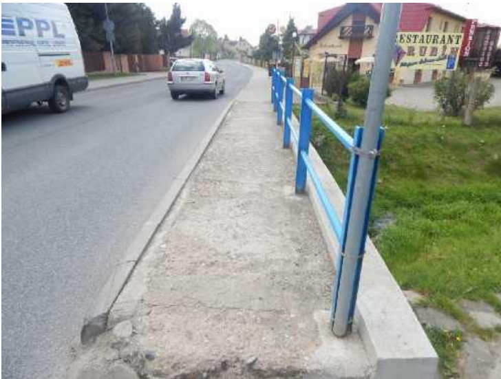
Povrchová degradace chodníku na pravé straně.