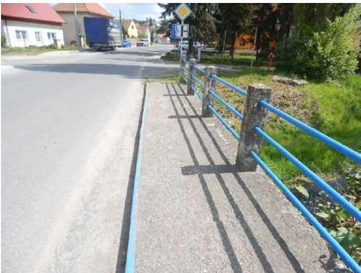
Pohled na chodník na levé straně.