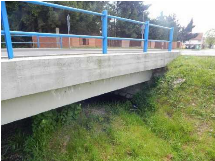
Pohled na pravý bok mostu.