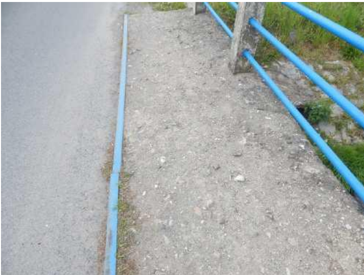
Hlubková plošná degradace horního líce betonového chodníku na pravé straně.