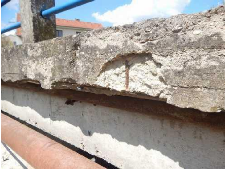
Rozpad boku železobetonové římsy.