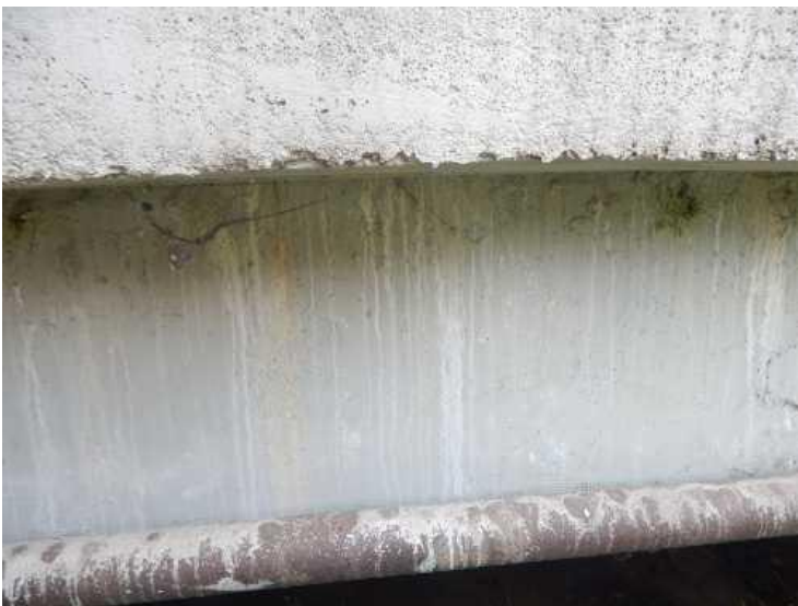
Stopy po průsacích pod římsou.