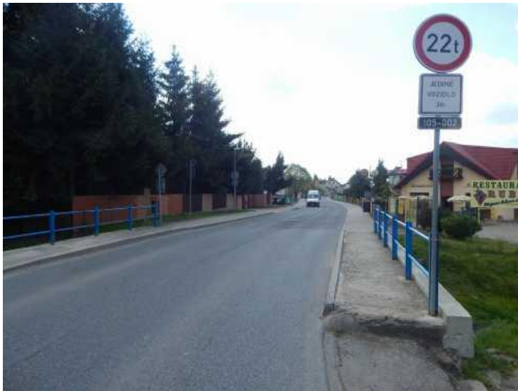
Šířkové uspořádání ve směru staničení.