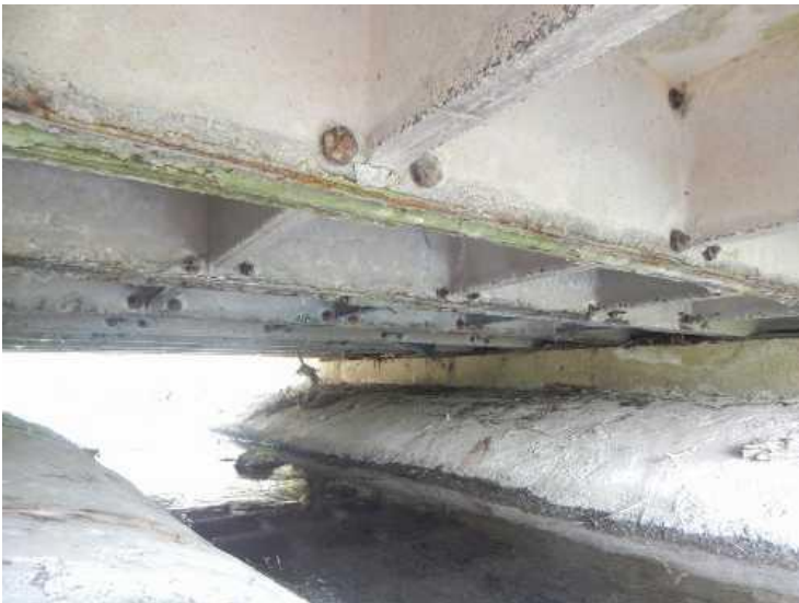
Detail separace krycí vrstvy a koroze betonářské výztuže. Koroze spojovacích šroubů.