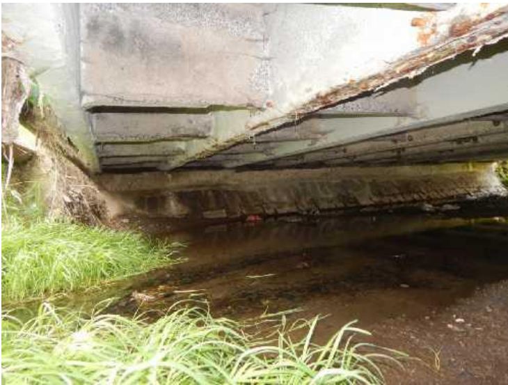
Silné průsaky ve spáře mezi nosníky, na spodní pásnici obnažená silně korodující betonářská výztuž.