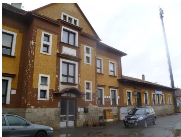
objekt původní čekárny a WC pro veřejnost