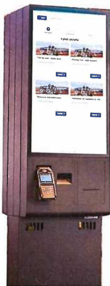
Orientační zobrazení pokladny, finální verze se může lišit (umístění a typ terminálu, výřez pro vstupenky apod.)