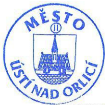
Petr Hájek za pronajímatele