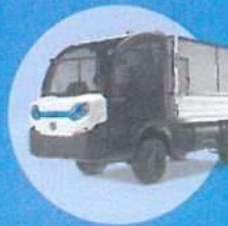
Plošina s nástavbou

Obchodní název GOUPIL G4 Long Celková hmotnost 2100 kg