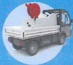
Vyklápěcí korb Vysokotlaké čištění