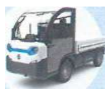
Pevná / sklápěcí plošina