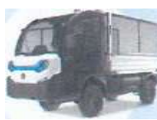
Plošina s nástavbou