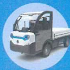
Pevná / sklápěcí plošina