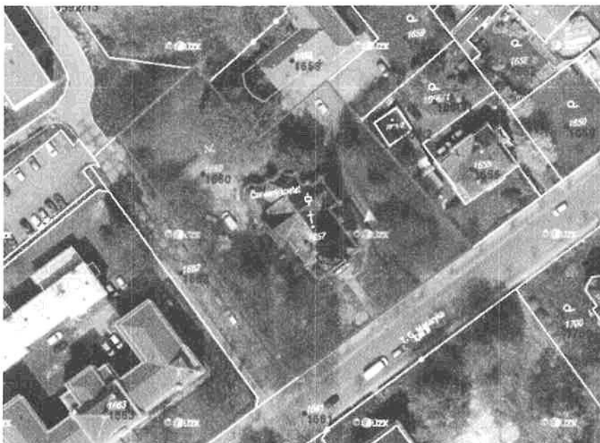
Obr.: Rozsah řešeného území