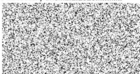
Obec Příčovy objednatel