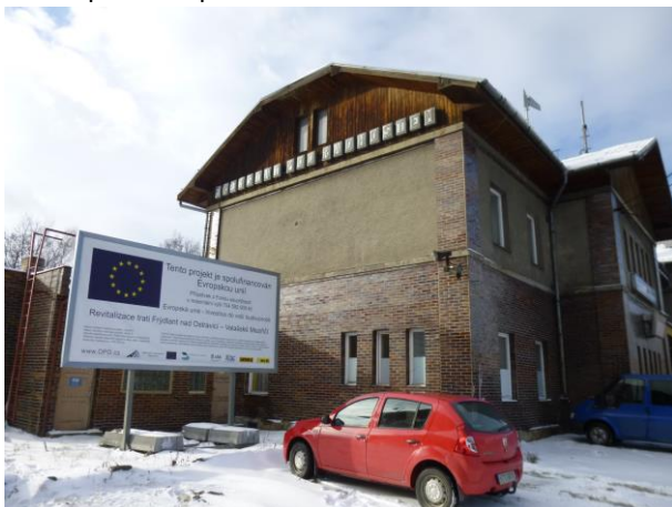
Uliční pohled a průchod