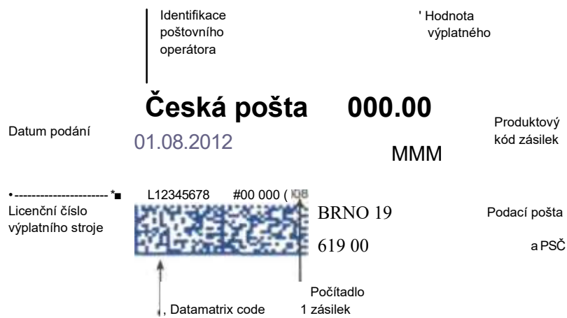
Obr. 2: Rozmístění informací na digitálním otisku