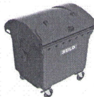
ILUSTRAČNÍ FOTOGRAFIE