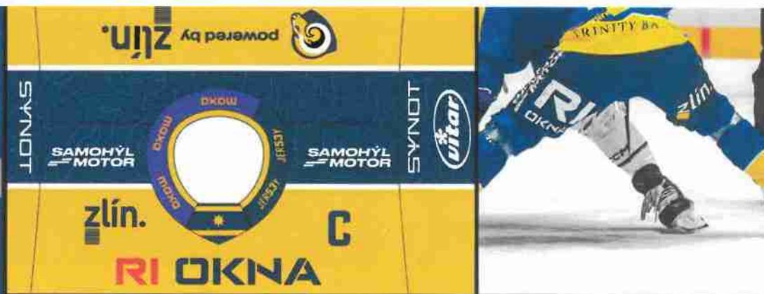
Pozice: Dres a hráčská výstroj - 5. 6. 7. 8.