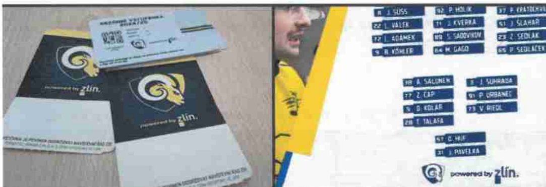
Pozice: Logo na vstupenkách a Online package - 13. 30.