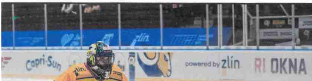
Pozice: LED panel na TV straně - 9. - vizuál dle dodání SMZ