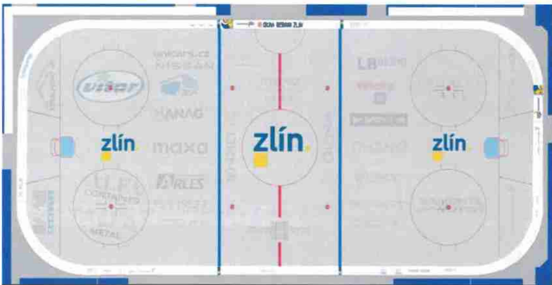
Pozice: Ledová plocha a mantinel - 1. 2. 3. 4. 14. 15.