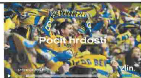
Pozice: Spoty a MLM kostka - 25. 28. 31. 32. - vizuál dle dodání SMZ