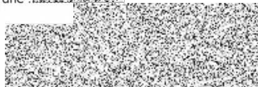
ČEZ Distribuce, a. s.