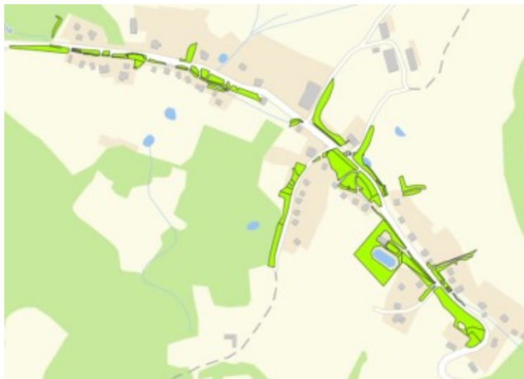
Hrušková – interval pokosu 5