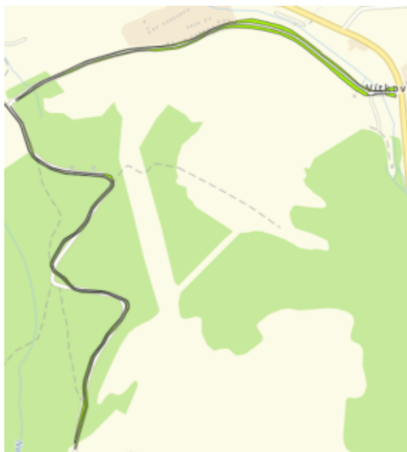
Novina, Vítkov – interval pokosu 5