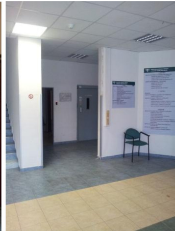
obrázek č. 10