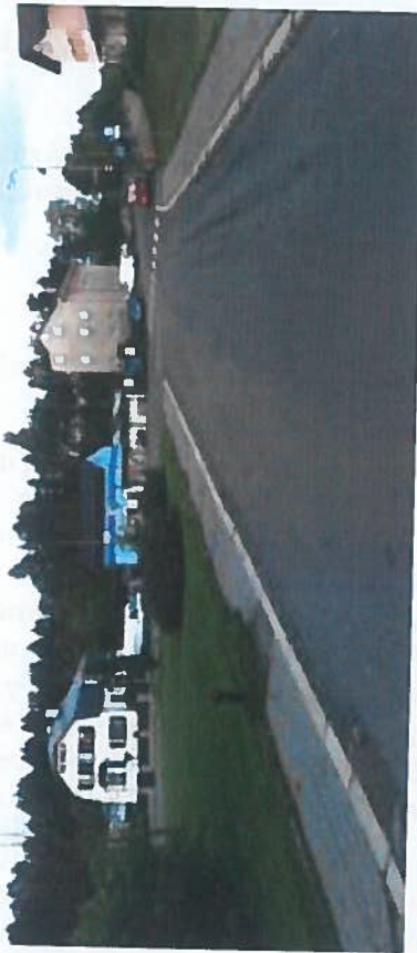
Silnice III/28712 Rychnov u Jablonce nad Nisou, rekonstrukce silnice