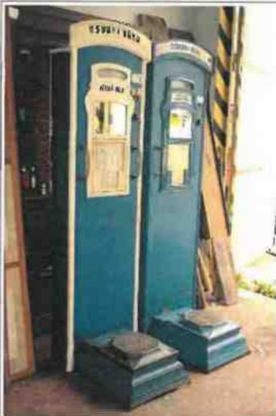
12. 68564 Osobní váha Columbus (1 kus)