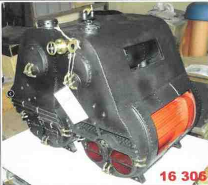
9. 16306 Model lodního parního kotle