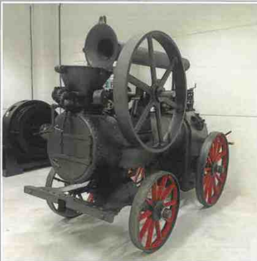
10. 15238 Lokomobila parní