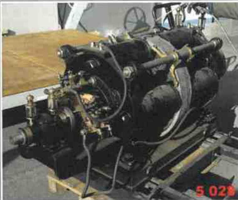
7. 5028 Dynamo Křížik