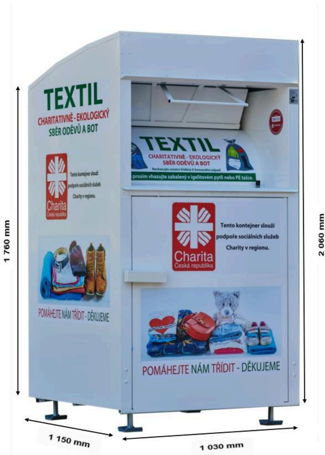
Schéma kontejneru na textil