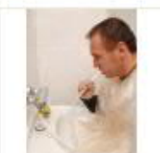
4 VOLAREZA K.Vary -zubní irigace