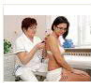
1 VOLAREZA K.Vary -plynová injekce