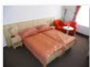
8 VOLAREZA K.Vary SP-pokoj Standard