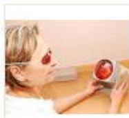
7 VOLAREZA K.Vary -solux