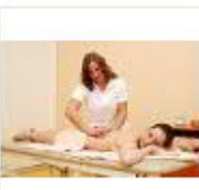
10 VOLAREZA K.Vary -masáž klasická částečná