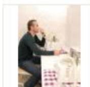
2 VOLAREZA K.Vary -inhalace