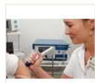
5 VOLAREZA K.Vary -rázová vlna