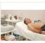
3 VOLAREZA K.Vary-EKG