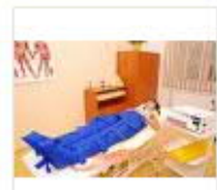
11 VOLAREZA K.Vary -lymfodrenáž přístrojová