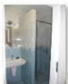
9 VOLAREZA K.Vary SP-koupelna pokoj Standard