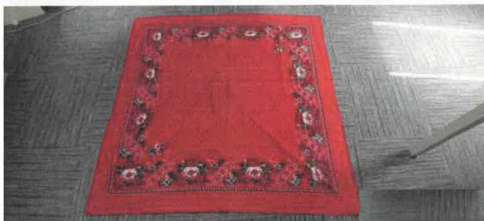
Doplňková součást svátečního kroje