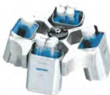
Adapter 2,6 - 7 ml