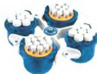
Adapter 2,6 - 8 ml