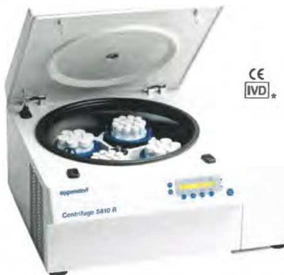
Centrifuga 5810 R