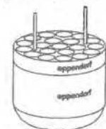
Adapter 5,5 - 12 ml