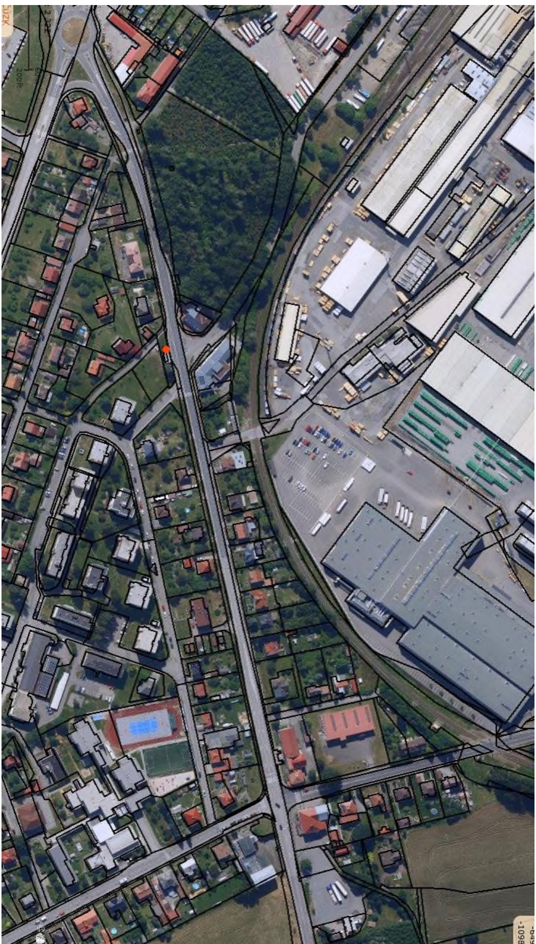
Zákras umístění informačního panelu – p. č. 290/7 v k. ú. Ždírec nad Doubravou – vedle autobusové zastávky – červená tečka