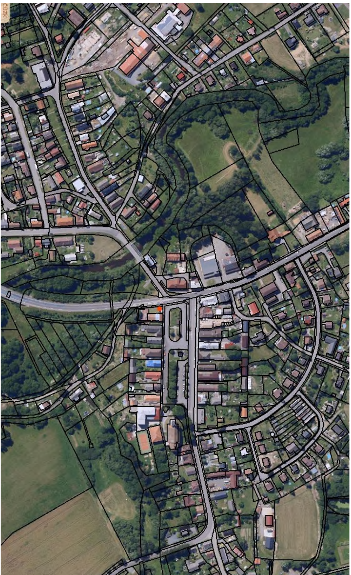
Zákres umístění informačního panelu – p. č. st. 64/1 v k. ú. Trhová Kamenice – jižní okraj náměstí – červená tečka