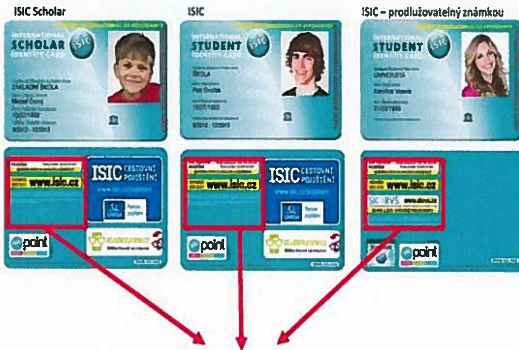
Samolepka relace pro Žákovské jízdné