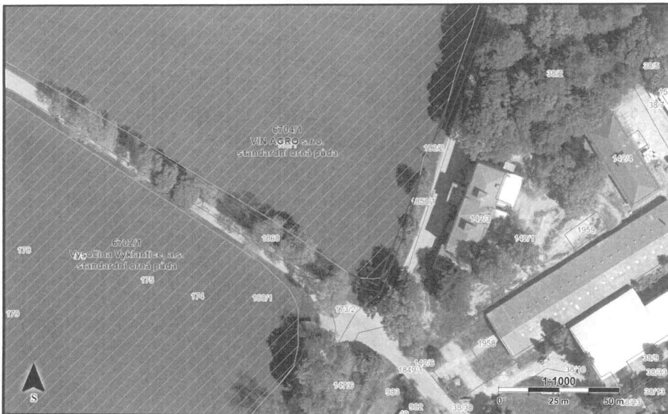
část pozemku p. č. KN 1765 v k. ú. Vyklantice