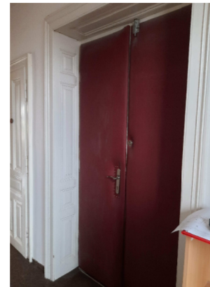
POHLED Z M.C.313