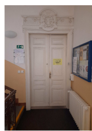
POHLED Z CHODBY