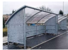
Ukázka varianty s prodlouženou boční výplní a dorazy.