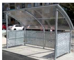
Ukázka varianty s nízkou boční výplní