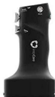
Univerzální opakovaně použitelná rukojeť

Jedná se o inteligentní platformu s programově řízenou kontrolou