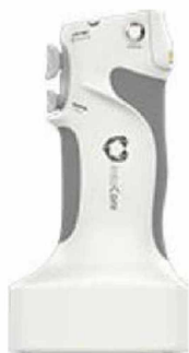
Univerzální jednorázová rukojeť

Univerzální rukojeť s elektrickým pohonem s elektronikou, je navržena k připojení kompletní řady našich jednorázových staplerů, což snižuje nutnost měnit různé nástroje během procedury, redukuje délku operačního výkonu, snižuje celkové procedurální náklady a zároveň zkracuje učební křivku.