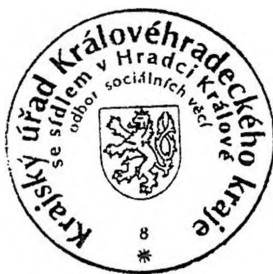
Bc. Tomáš Grulich

Krajský úřad Královéhradeckého kraje, odbor sociálních věcí, Pivovarské náměstí 1245/2, Hradec Králové, 500 03 Hradec Králové 3, který rozhodnutí vydal. O podaném odvolání rozhoduje Ministerstvo práce a sociálních věcí ČR.