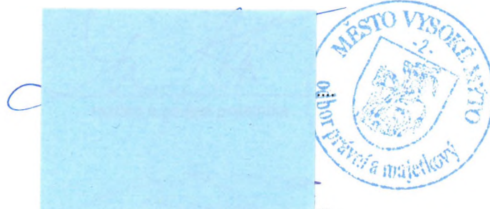
razítko a podpis pojistitele