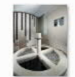
32 VOLAREZA Bedřichov Kneippův chodník