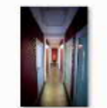
35 VOLAREZA Bedřichov -wellness služby