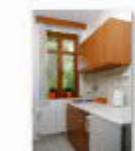
10 VOLAREZA Bedřichov - depandance kuchyňka