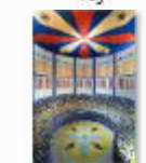
28 VOLAREZA Bedřichov parní solná sauna