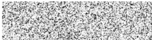
RICOH Czech Republic s.r.o. pronajímatel