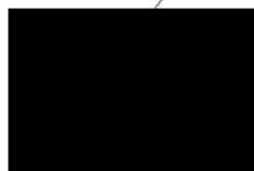
za poskytovatele Ing. Peter Harvánek