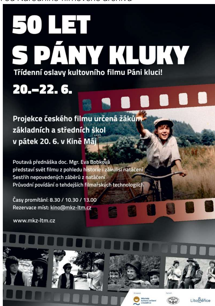
Obr. 1: leták na oslovení škol