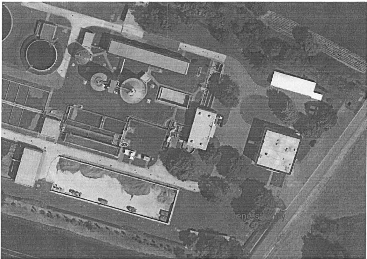
Obr.1 – situace s vyznačením řešených objektů

Předmětem zadání je vypracování jednostupňové projektové dokumentace na výměnu střešní PVC fólie. Jedná se o dva objekty v areálu společnosti Vodárenská Svitavy s.r.o.. V rámci projektové dokumentace bude řešena demontáž hromosvodů a klempířských prvků. Stavební záměr je udržovací práce, která nepodléhá povolení záměru.