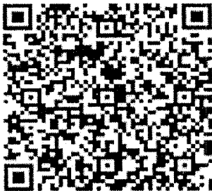
QR kod pro platbu

Společnost M.E.D.I.C.A. permanent care s.r.o. je P+ projektem Renaissance Zástupce pro Prahu je [redacted]